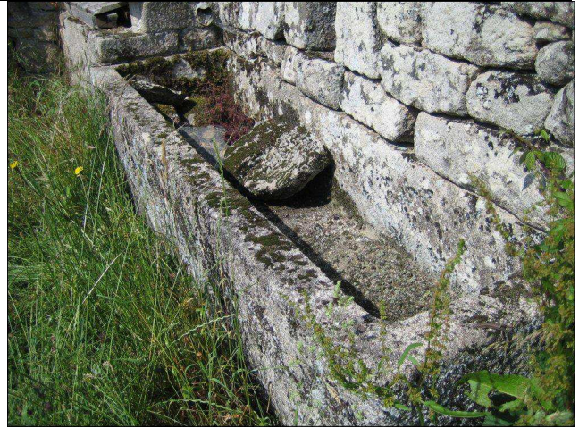
Un sarcophage à La Salesse